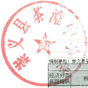
一般公共预算财政拨款基本支出决算表